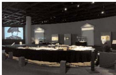
Museu de Arte Brasileira - MAB

Museu Brasileiro da Escultura - MUBE Rua Alemanha, 221 - Jd. Europa Tel: 55 11 3081-8611